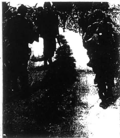
Sybila una de las víctimas de este régimen fascista y violento.

¿Qué piensa de la afirmación de que la Asociación le hace el juego a Sendero Luminoso?