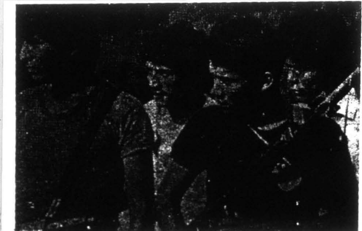
Nosotros no llamamos prisioneros de guerra a los condenados por terrorismo, sino es la realidad misma porque aquí en el país ¡hay una guerra!

No necesariamente... defender al proletariado, al campesinado. También a