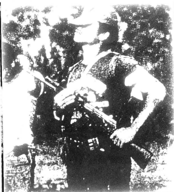
El Estado tiene derecho a usar la violencia, pero los explotados también a levantarse y luchar por el poder.